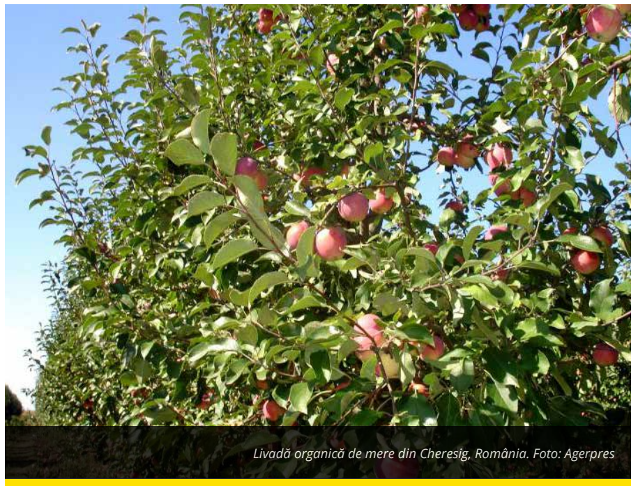
Livadă organică de mere din Cheresig, România.

Irimescu: Vreau să respectăm calendarul propus și să începem plata subvențiilor APIA pe 8 aprilie ..... 7