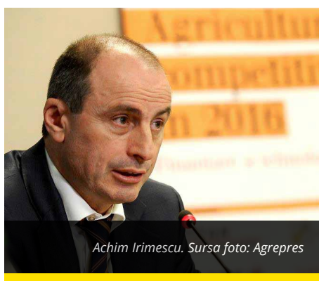
Achim Irimescu.

Ministrul Agriculturii, Achim Irimescu, promite că plata subvențiilor APIA va începe pe 8 aprilie. El susține că i-a verificat pe funcționari și aceștia lucrează și în weekend pentru a respecta termenele propuse.