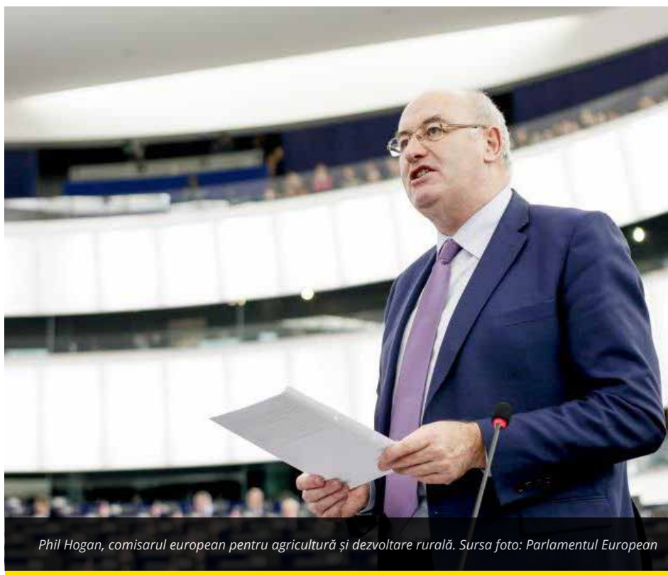
Phil Hogan, comisarul european pentru agricultură și dezvoltare rurală.

„O alocare de doar circa 12 procente (...) poate fi considerată insuficientă, cu atât mai mult cu cât, din punctul nostru de vedere, beneficiarii privați au performat mai bine în alocarea bugetară anterioară”,